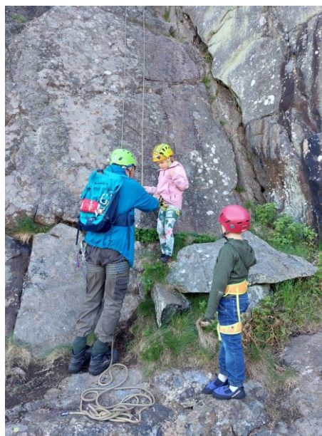
Klättring på Lysekils klippor