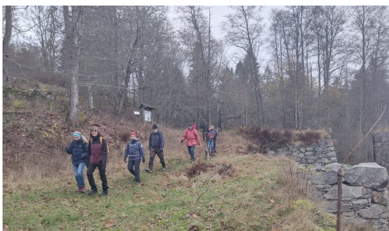
Vandring vid Borgmästarbruket, Munkedal

Under året har vi haft vardagsvandringar varannan tisdag, från 1 mars till 31 maj. Uppehåll över sommaren, sedan återupptogs vandringarna varannan tisdag på hösten, från den 20 september till och med den 29 november. En extratur hölls även på sommaren, på Ramsvikslandet i slutet av juni. Vandringar på helger har det inte blivit så många. Vi hade en vandring på Bohus Malmön en lördag i maj och en på Kynnefjäll en söndag i oktober. En vandring runt Viksjöleden ställdes in. Vandringarna har varit uppskattade, mellan 3 - 10 deltagare, förutom ledarna. Vandringarna har varit på olika platser i Bohuslän, både kustnära och i skogsterräng. Flera har kommit för att prova på, utan att vara medlemmar och det har fått till resultat att de blivit medlemmar i Friluftsfrämjandet. Vandrings ledarna har under året haft två träffar bl a ett för ledardagarna i Dalafjällen.