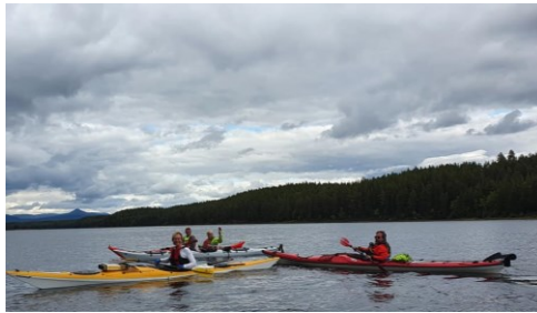
Kajak på Österdalälven