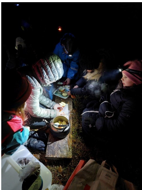
Matlagning i mörker