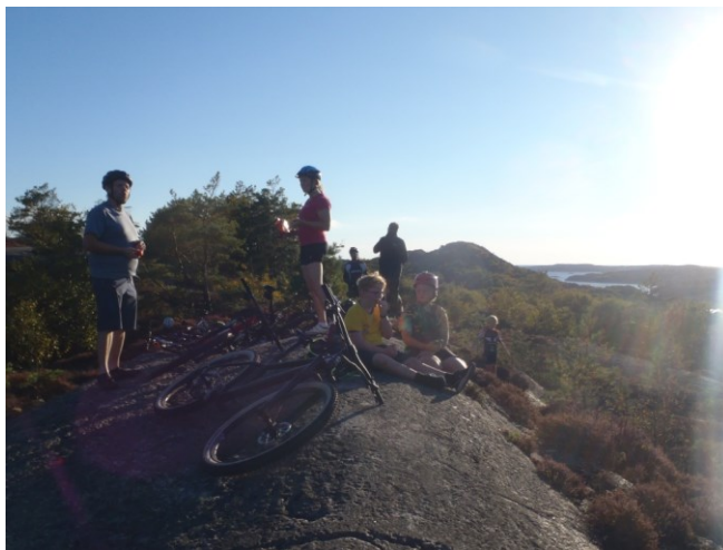
Välförtjänt fika med utsikt