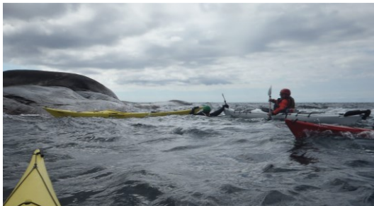
Kamraträddning i hög sjö

En övernattningsstur med 5 deltagare gjordes i Fjällbacka skärgård. En fortbildning i säkerhet genomfördes i Grebbestad där Nautopp stod för undervisningen. Traditionella glöggpaddlingen och nyårspaddlingen genomfördes också med många deltagare. Nya ledarspiranter har tillkommit under säsongen vilket underlättat för "di gamle" att genomföra paddlingarna.