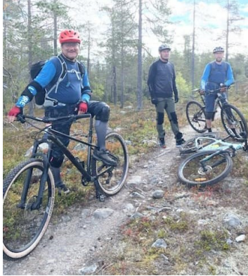
MTB på Idre fjäll

20 deltagare hängde på 4 ledardagar i Särna, Dalafjällen och bodde på Knappgården. 3 olika aktiviteter erbjöds såsom vandring, kajak och MTB. Värdskap, väder, mat, boende och aktiviteterna var mycket bra. Spelmän från trakten underhöll och berättade om den lokala musiktraditionen.