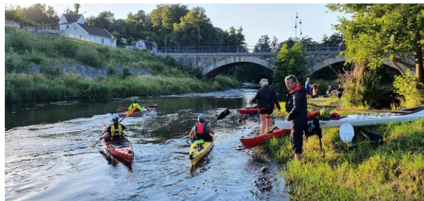
Paddling mot Kviströms bron