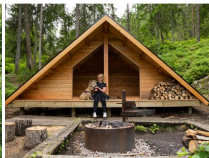
Nya vindskyddet Strömmarna